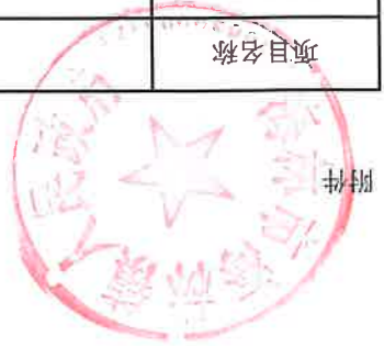
项目支出绩效目标执行监控表 (2022年度)