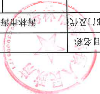
项目支出绩效目标执行监控表 (2022年度)