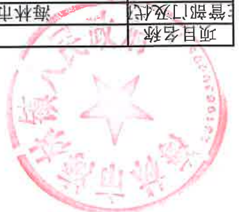
项目支出绩效目标执行监控表