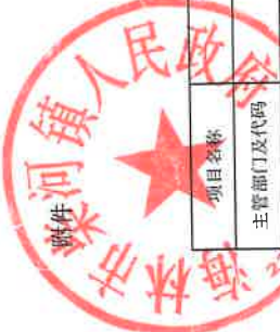
项目支出绩效目标执行监控表 (2023年度)