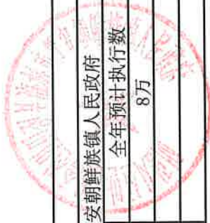
项目支出绩效目标执行监控表 (2023 年度)