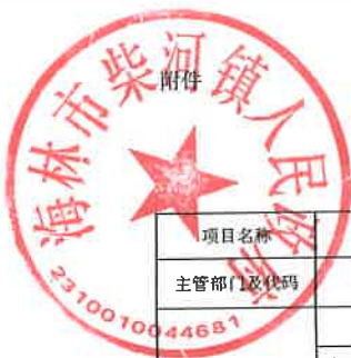
项目支出绩效目标执行监控表 (2022年度)