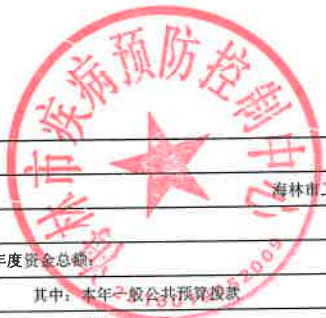
项目支出绩效目标执行监控表 (2022年度)