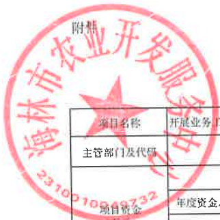
项目支出绩效目标执行监控表 (2022年度)