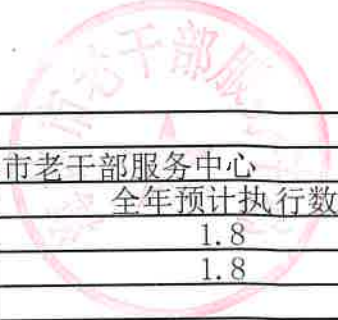
项目支出绩效目标执行监控表 (2022年度)