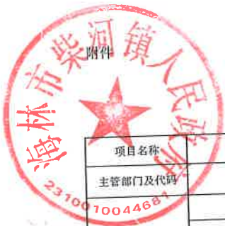
项目支出绩效目标执行监控表 (2022年度)