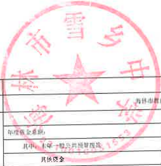
教学业务费项目支出绩效目标执行监控表 (2022年度)