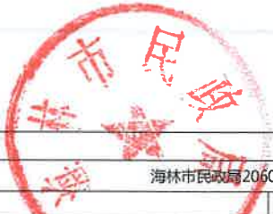
项目支出绩效目标执行监控表 (2022年度)