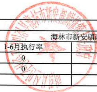
项目支出绩效目标执行监控表 (2022年度)