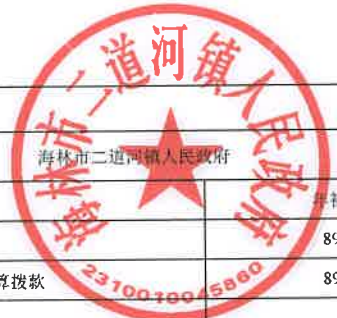
项目支出绩效目标执行监控表 (2022年度)