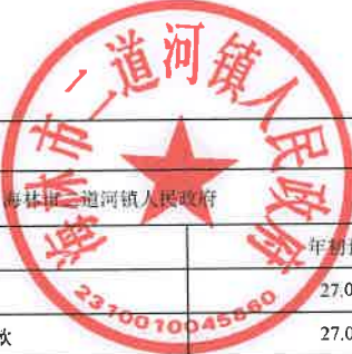
项目支出绩效目标执行监控表 (2022年度)