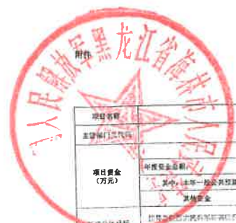
项目支出绩效目标执行监控表 (2022年度)