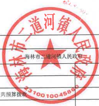
项目支出绩效目标执行监控表 (2022年度)