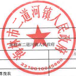
项目支出绩效目标执行监控表 (2022年度)