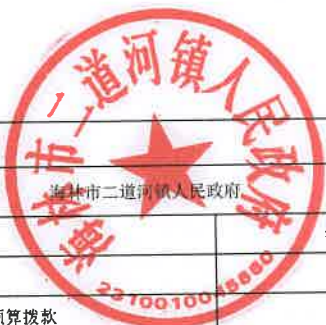
项目支出绩效目标执行监控表 (2022 年度)