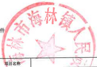
项目支出绩效目标执行监控表 (2022年度)