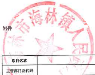
项目支出绩效目标执行监控表 (2022年度)