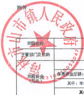
项目支出绩效目标执行监控表 (2022年度)