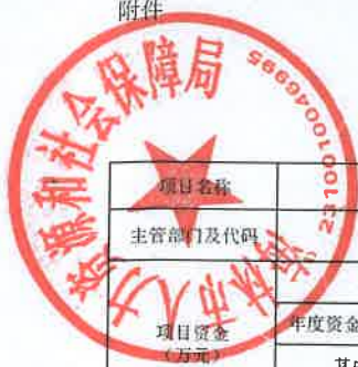
项目支出绩效目标执行监控表 (2022年度)