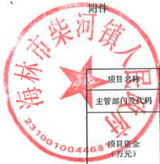
项目支出绩效目标执行监控表 (2022年度)