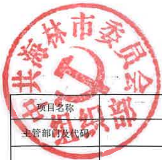
项目支出绩效目标执行监控表 (2022年度)